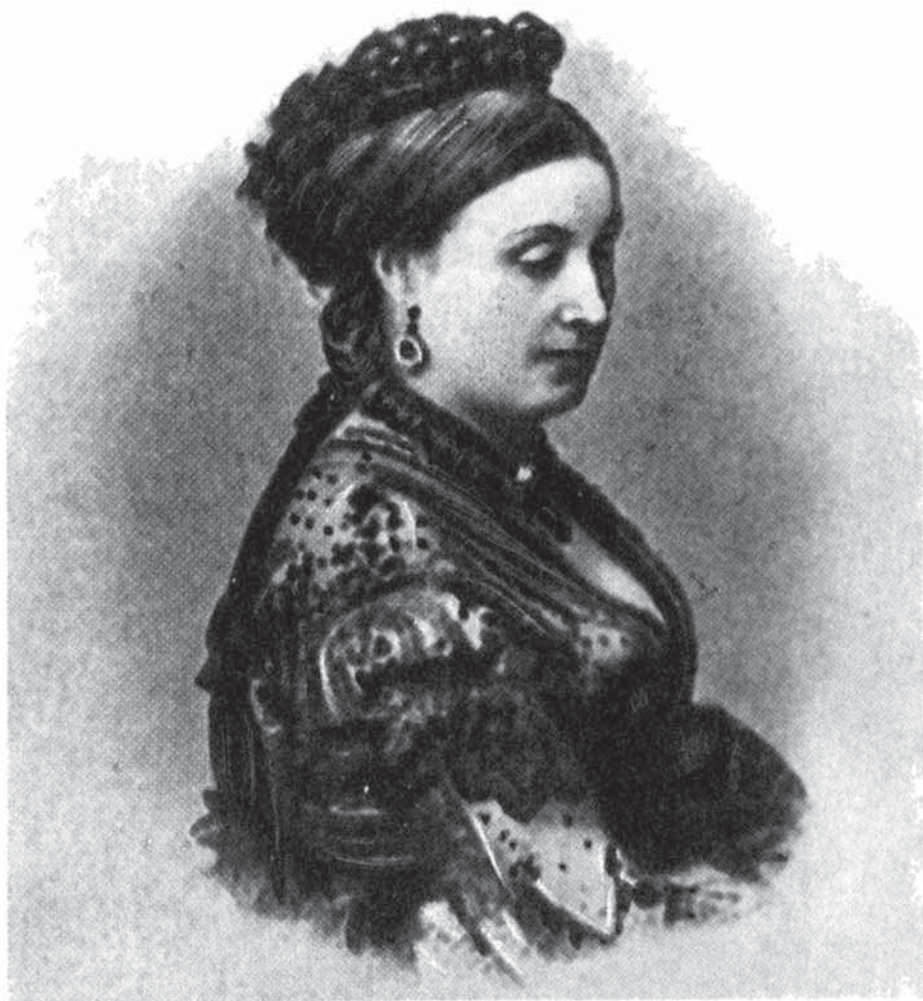
А. Д. Блудова

Вот какую характеристику дал Блудову в своих «Записках» французский писатель Ипполит Оже: «Он был среднего роста и начинал полнеть. С первого раза лицо его не казалось привлекательным, хотя в нем не было ничего безобразного. Но оно совершенно преображалось, когда он начинал говорить. Быстрый, логический ум, обилие мыс-